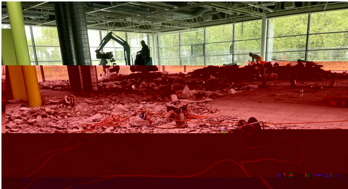
Centre Loewenberg – restaurant avant