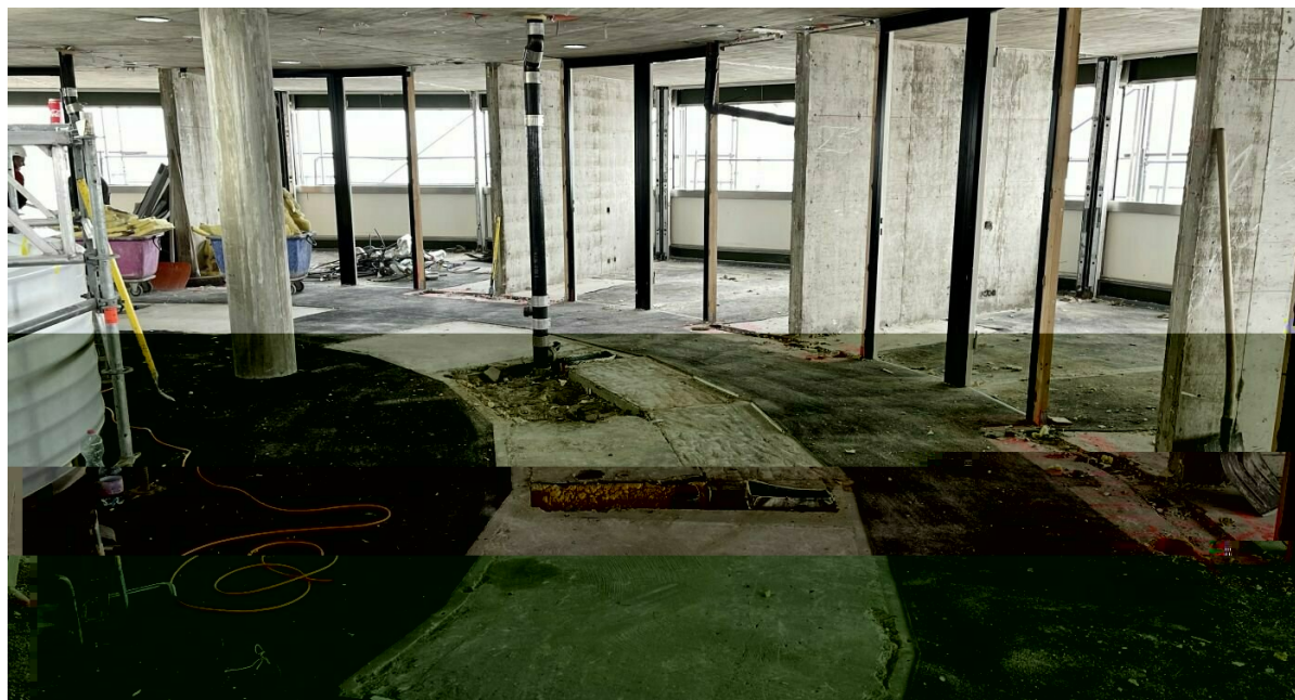
Centre Loewenberg – Pavillon résidentiel avant

Grâce à la rénovation et à la modernisation, la consommation énergétique future des bâtiments sera réduite: l'équivalent de la consommation d'énergie d'une soixantaine de maisons individuelles anciennes, soit 600 000 kWh, sera économisé chaque année. La nouvelle installation photovoltaïque permet au Centre Loewenberg de couvrir tous ses besoins en réfrigération. Le surplus de courant est injecté dans le réseau public d'énergie. 98% des éléments en béton et en métal de la structure et de l'enveloppe du bâtiment ont été réutilisés. Les structures portantes des façades ont également été rénovées et remises en place. Les chaises rembourrées et le mobilier revalorisé ou fabriqué à partir de matériaux recyclés ne demandent qu'à être utilisés. Tout cela est en phase avec la stratégie de durabilité des CFF, qui promeut également l'économie circulaire.