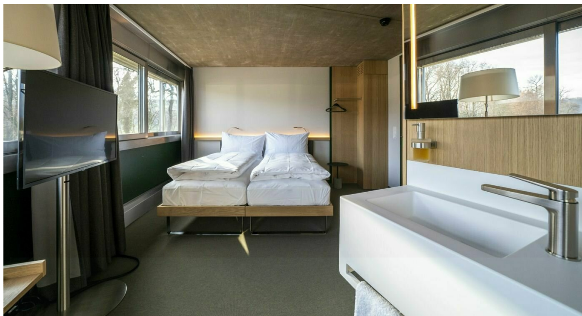
Centre Loewenberg – Pavillon d'habitation, chambre double après